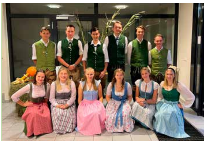
Die Öblarner Landjugend vor der Polonaise beim Bezirkserntedankball in Gröbming.

Unter dem Motto „Mit allen Sinnen erleben“ fand heuer die Feriengaudi statt, bei der Landjugendmitglieder gemeinsam mit den Kindern spielerisch die Welt der Sinne erkundeten. Besonderer Höhepunkt war ein selbst gestalteter Barfußweg aus verschiedenen Naturmaterialien, der mit Begeisterung ausprobiert wurde. Weitere Stationen wie Geräusch-Memory, Geruchs- und Fühlboxen sowie kreative Bewegungsangebote sorgten für einen abwechslungsreichen Nachmittag, der beim gemeinsamen Grillen seinen stimmungsvollen Abschluss fand.