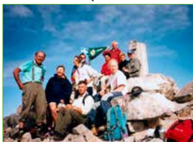
Eine Gruppe des ÖAV Öblarn war 2001 bereits auf dem Olymp.

Rund um die Besteigung des Olymp bietet es sich natürlich an, ein paar Tage Urlaub in Griechenland zu verbringen. Der Aufenthalt kann dabei, ebenso wie die Anreise (mit eigenem Auto, Motorrad oder auch Fahrrad über eine Fähre oder mit dem Flugzeug) nach eigenen Wünschen individuell gestaltet werden. Idealerweise finden sich dafür Gruppen von Gleichgesinnten, die einzelne Aktivitäten oder auch