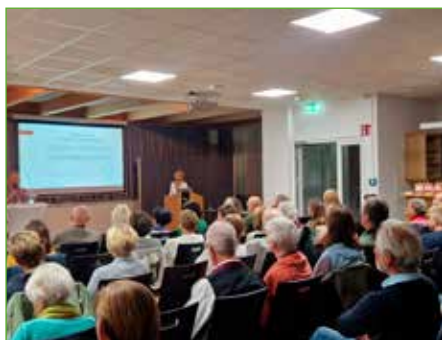
Aufmerksame Zuhörer bei den Vorträgen über Schlaflosigkeit