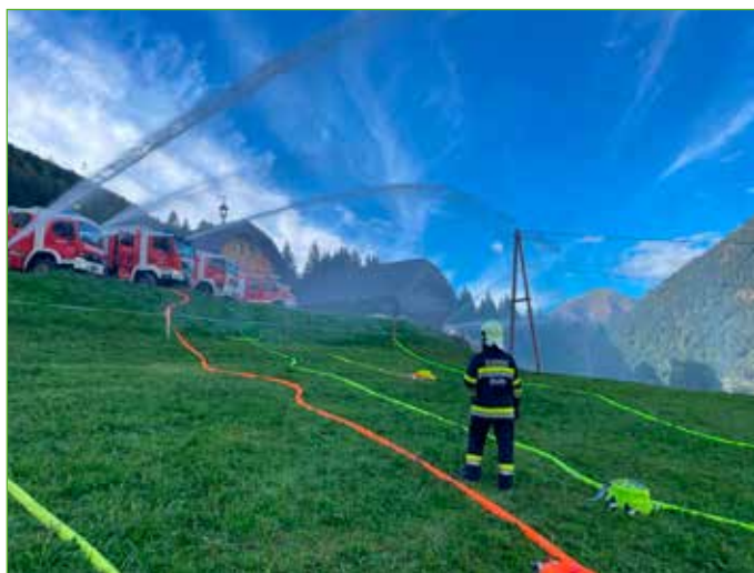
Die Abordnung der FF Öblarn bei der Sanitätsleistungsprüfung in Admont.

Hier sind z.B. die Atemschutzübung im Walchener Schaubergwerk Thaddäusstollen gemeinsam mit der Freiwilligen Feuerwehr Stainach und der Freiwilligen Feuerwehr Unterburg, die Abschnittsübung in Mössna-St. Nikolai sowie die Jahresübung mit der Feuerwehr Niederöblarn hervorzuheben.