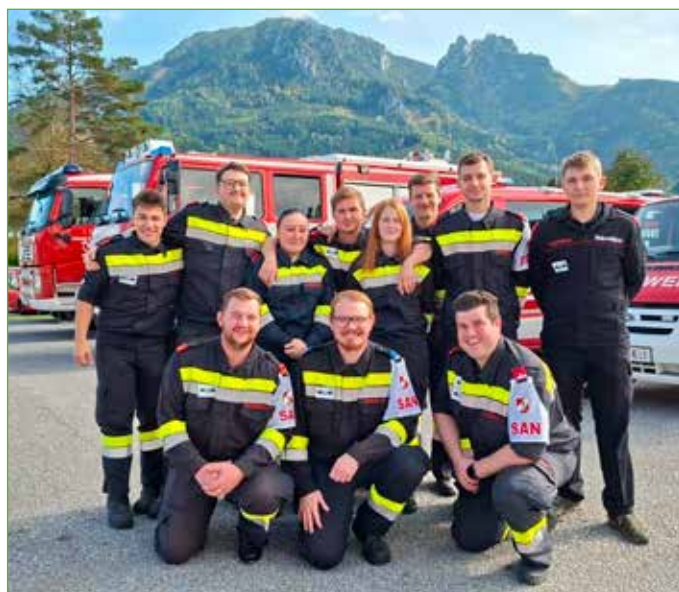
FF Öblarn aktiv bei der Abschnittsübung in Mössna-St. Nikolai.

Im Bereich Aus- und Weiterbildung wurde viel Engagement gezeigt. Zahlreiche Kameradinnen und Kameraden nahmen an den Bewerbungen um die Leistungsabzeichen in den Bereichen Sanität, Funk und Atemschutz teil. Außerdem konnten diverse Kurse an der Feuerwehr- und Zivilschutzschule in Lebring besucht werden.