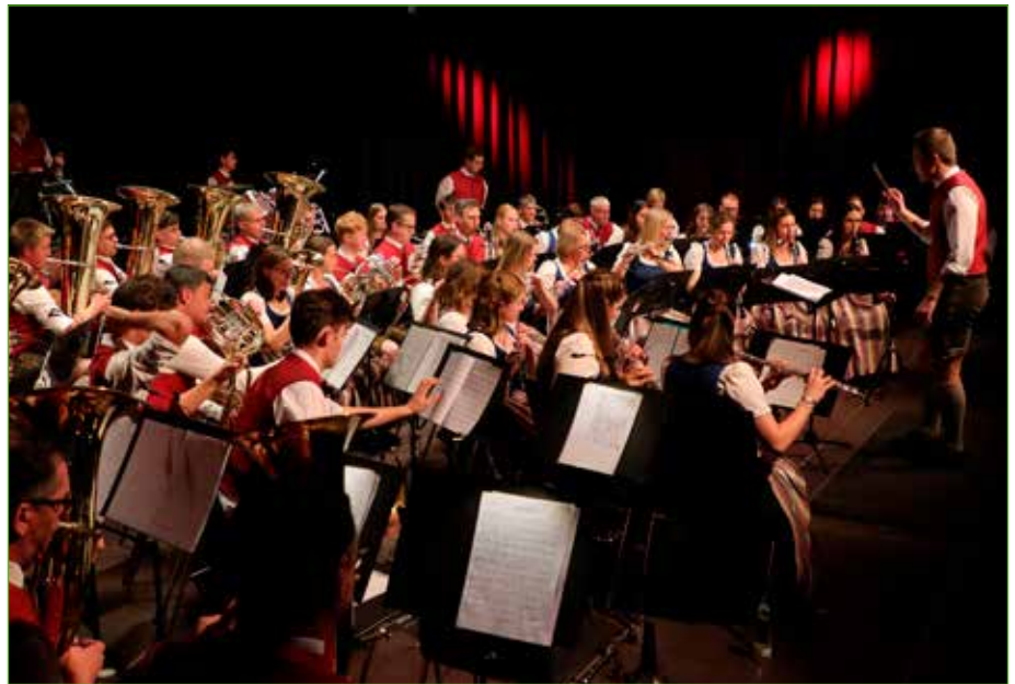
Mit über 60 Musizierenden beim Wunschkonzert war die ÖHA-Bühne prall gefüllt.

Nach diesem Erfolg waren die MusikerInnen motiviert für das jährliche Wunschkonzert, welches