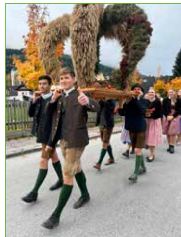
Die Landjugend gestaltete auch heuer wieder die Erntekrone in Öblarn.

Beim Erntedankfest in Öblarn war die Landjugend wieder aktiv dabei. Wie jedes Jahr durfte die selbst gebundene Erntekrone festlich geschmückt in die Kirche getragen werden und der Gottesdienst wurde mitgestaltet. Danach bewirteten die Jugendlichen die Besucherinnen und Besucher im ÖHA. Ein herzlicher Dank gilt allen Helferinnen und Helfern, die zum Gelingen dieses Festes beigetragen haben.